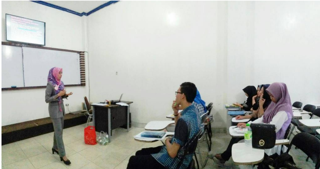
Gambar 1 Peserta Antusias Dalam Mendengar Materi

kita. Peserta begitu antusias dengan materi yang disampaikan dan berusaha menggali potensi dan peluang yang ada disekitar mereka. Para peserta juga sangat tertarik dan memiliki rasa ingin tahu yang tinggi mengenai bagaimana media online menjadi peluang bisnis dalam berpromosi.