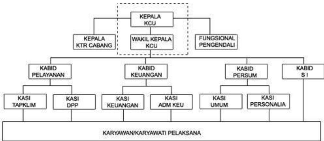
Gambar 3.2 Struktur Organisasi